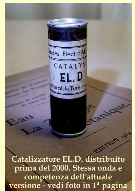
Catalizzatore EL.D. distribuito prima del 2000. Stessa onda e competenza dell'attuale versione - vedi foto in 1ª pagina

La Mancanza di EL.D. favorisce la saturazione delle cellule di onde nocive dell'elettricità artificiale che costituisce l'habitat ideale per ospitare virus, batteri, ecc. quindi la formazione di uno stato di non salute. Potete comprenderne l'importanza per la vita. Trovate altre informazioni nel nostro sito www.momosturenne.it .